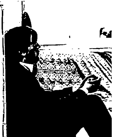
Le Trottoir des allongés de J.-L. Daniel.